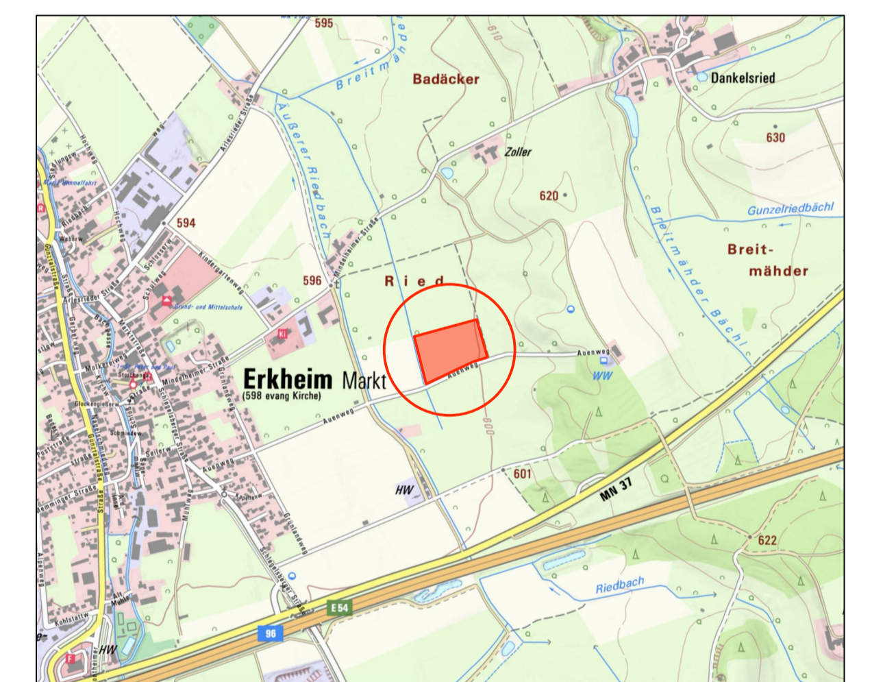
Übersichtslageplan ohne Maßstab