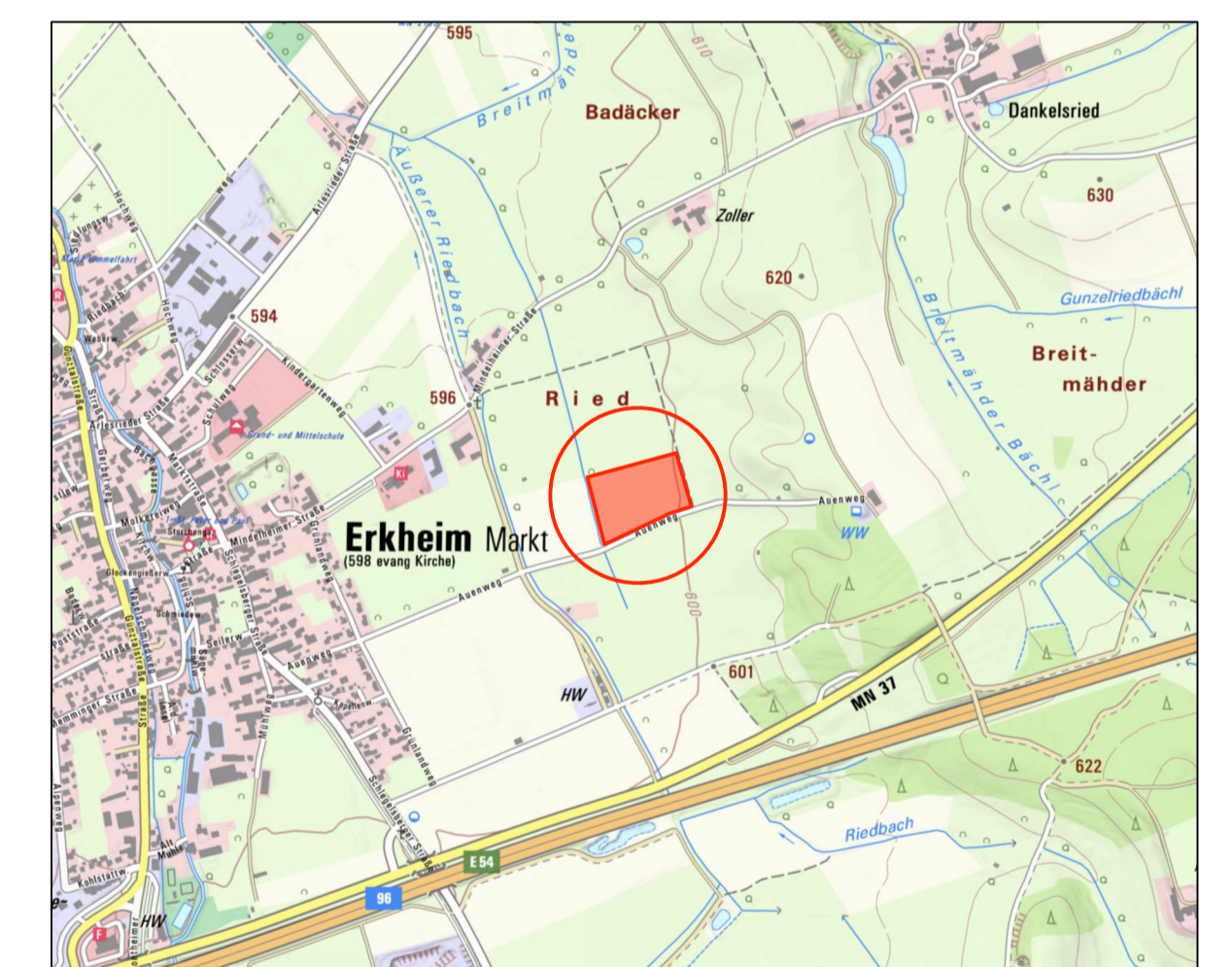
Übersichtslageplan ohne Maßstab