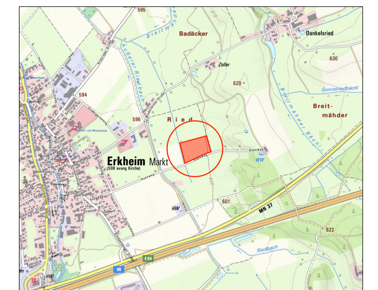
Übersichtslageplan ohne Maßstab © Reproduziert Landesamt für Umweltschutz, Bestand und Vervielfältigung